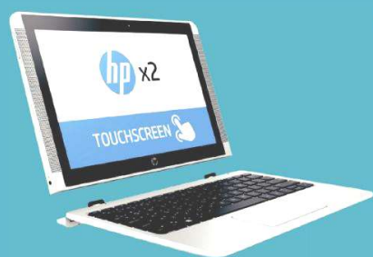
Tablette HP X2