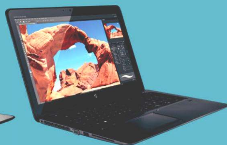
Ordinateur HP Zbook

La Région a négocié des tarifs préférentiels en moyenne 40% inférieurs au prix en magasin.